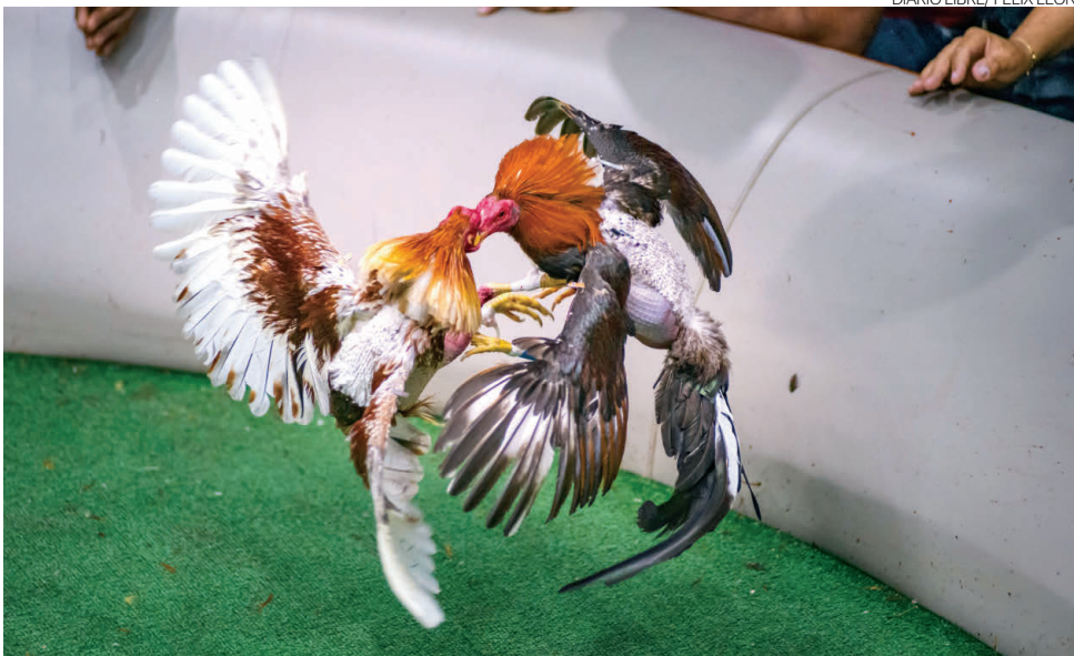
Las peleas de gallos son una práctica muy popular en América Latina y el Caribe.